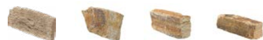
Placage Arrière Scie Placage Naturel Parements