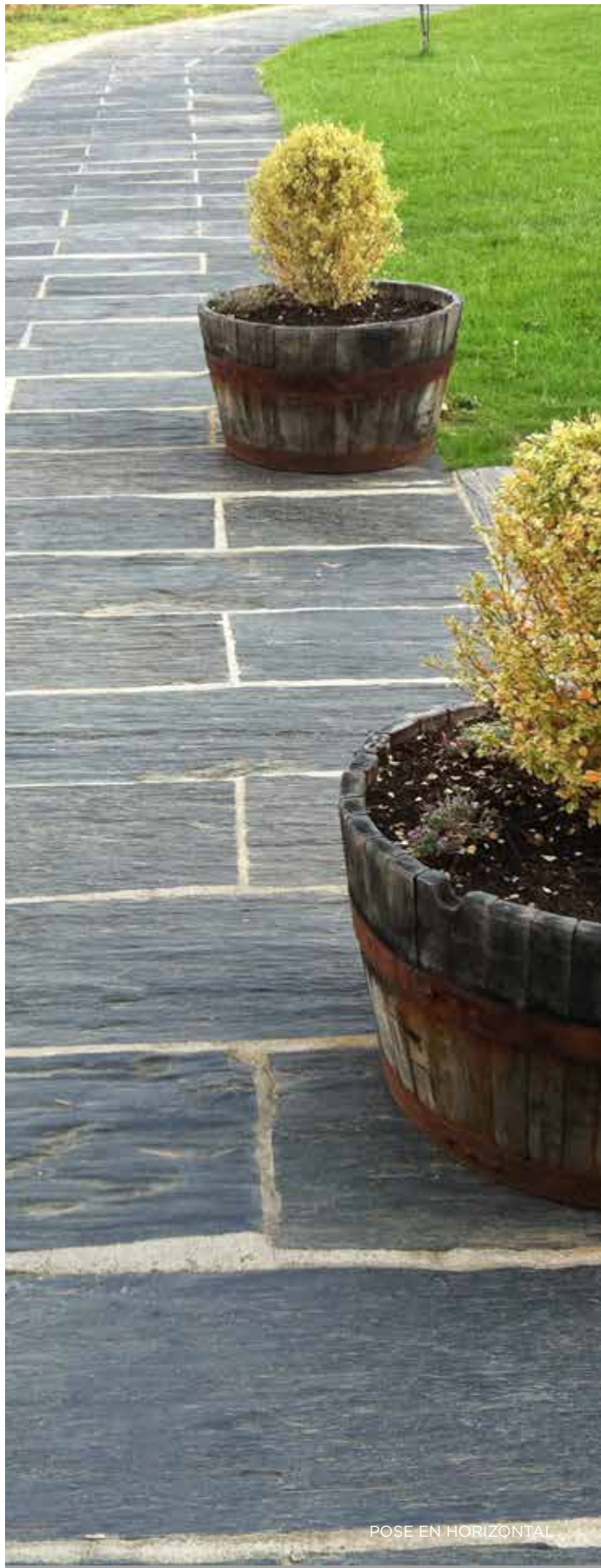
POSE EN HORIZONTAL

* Pour d'autres longueurs, consulter la disponibilité