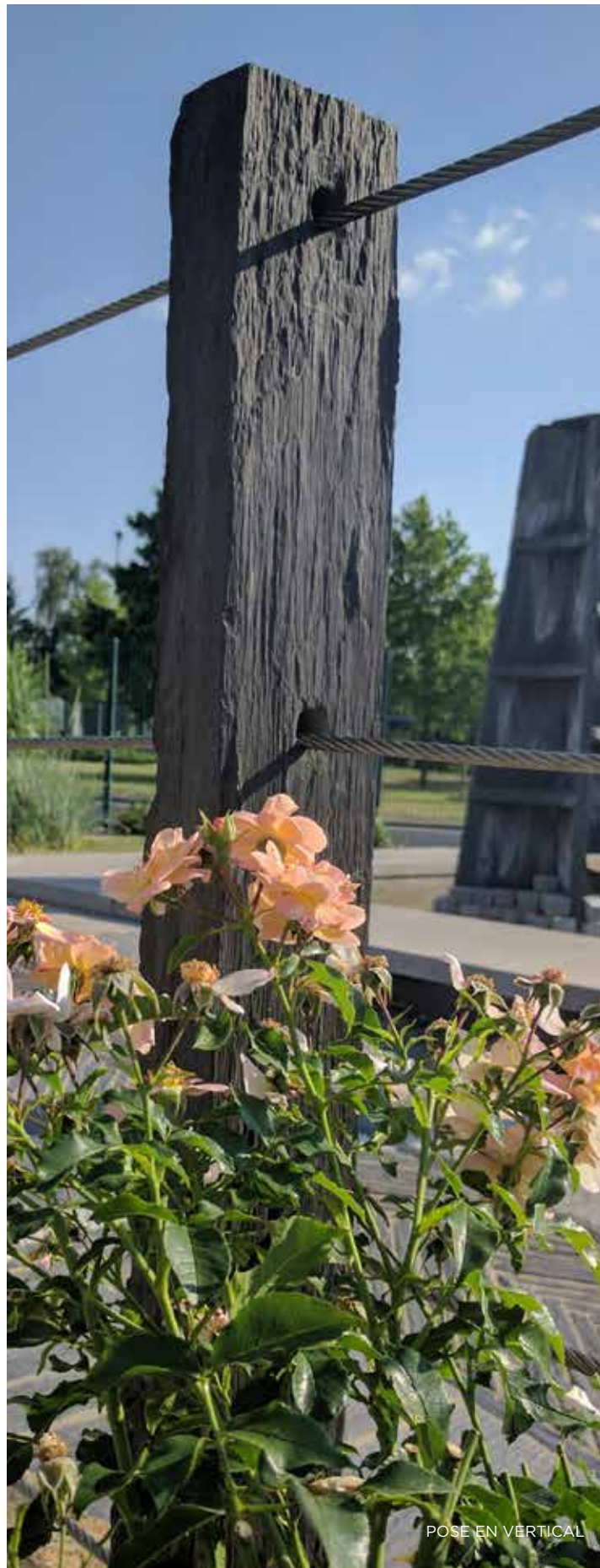
POSE EN VERTICAL