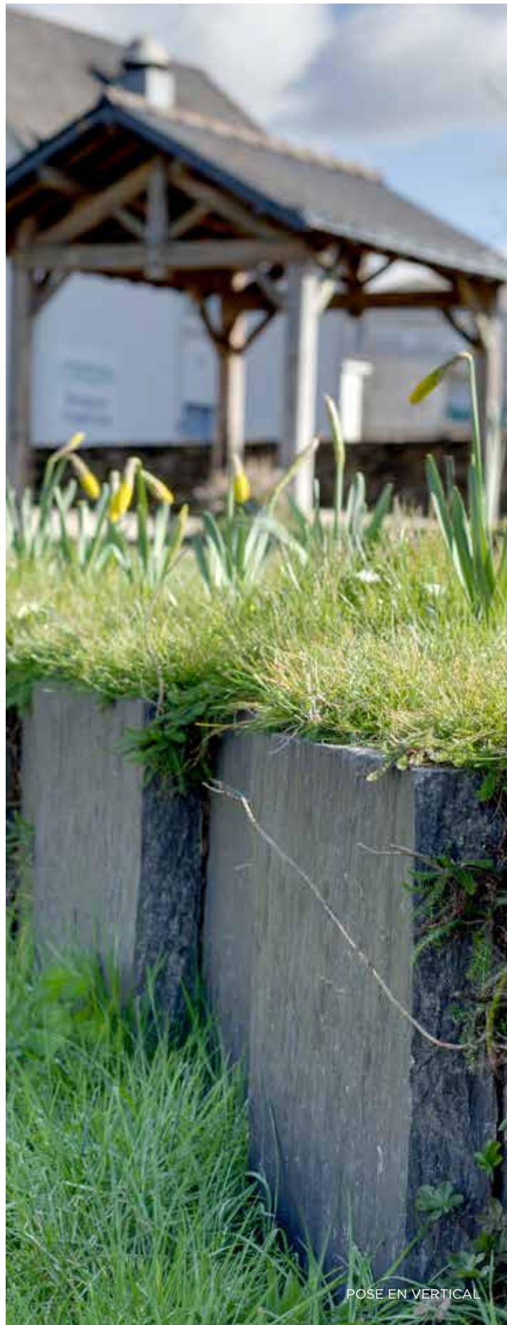
POSE EN VERTICAL