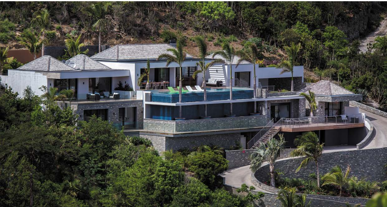
Villa Grace, une des 500 villas destinées à un tourisme de luxe sur l'île des Caraïbes.

Sur cette petite île du nord des caraïbes (25 km 2 ), entre végétation sauvage et plages translucides, les villas de luxe offrent chacune leur lot d'isolement sans pour autant négliger le confort d'une clientèle principalement constituée de touristes Nord et Sud-Américains. Situé à 2 500 kilomètres de New York, 180 de Porto Rico et 6 500 de Paris, Saint-Barthélemy est depuis trente ans sortie de son isolement séculaire pour s'imposer parmi les grandes destinations du tourisme de luxe dans le monde. C'est ici que les élites qui s'y retrouvent peuvent jouir de leur fortune à l'écart du monde. Estimées à 500 unités* - environ 80%* de l'offre d'hébergement de l'île - les villas en location sont très prisées et soumises à une surenchère de prestations toujours plus haut de gamme.