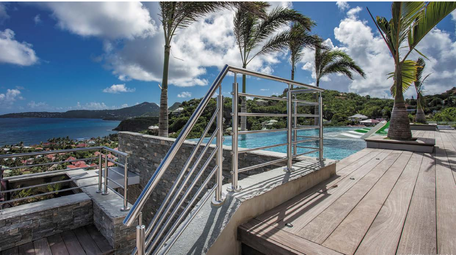
Villa Grace, une des 500 villas destinées à un tourisme de luxe sur l'île des Caraïbes.

« Villa neuve de 500 m 2 offrant vue unique à 180° sur la Baie de Anse des Cayes à Saint-Barthélemy... ». Quand, en septembre 2013, le propriétaire de ce terrain exceptionnel décide de faire construire une villa pour en retirer des revenus locatifs, il entend bien valoriser son patrimoine en privilégiant l'utilisation de matériaux nobles pour séduire une clientèle très haut de gamme. Construite à flanc de colline, la Villa Grace offre 6 chambres sur deux niveaux où terrasses et patios constituent autant d'alcôves avec vue sur les eaux translucides de la mer des Caraïbes.